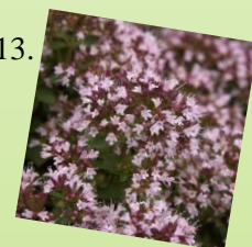
13. Pamajorán obyčajný 1 m 2 / 12 ks Slnčné až polotienisté stanovište