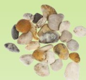
Dekoračný kameň Riečny štrk Frakcia: 4 – 8 mm