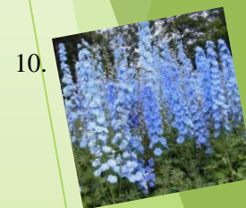
10. Stračonôžka 1 m 2 / 4 ks Slnčné až polotienisté stanovište