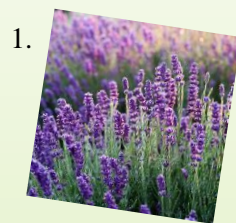
1. Levandula 1 m 2 / 6 ks Slnčné stanovište