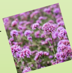
12. Železník argentínsky (Verbena) 1 m 2 / 7 ks Slnčné stanovište