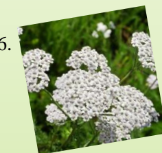
6. Myší chvost 1 m 2 / 4 ks Slnčné až polotienisté stanovište