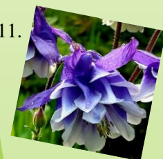
11. Orlíček obyčajný 1 m 2 / 12 ks Slnčné až polotienisté stanovište