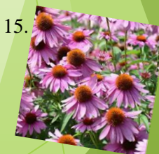
15. Echinacea purpurová 1 m 2 / 5 ks Slnčné stanovište