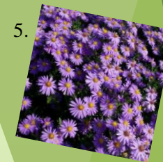
5. Astra nízka 1 m 2 / 9 ks Slnčné stanovište