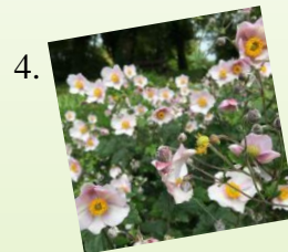
4. Veternica hupehenská 1 m 2 / 3 ks Slnčné až polotienisté stanovište