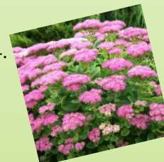
14. Rozchodníkovec nádherný 1 m 2 / 7 ks Slnčné stanovište