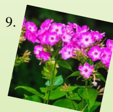
9. Plamienka (Flox) 1 m 2 / 7 ks Slnčné až polotienisté stanovište