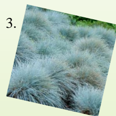
3. Kostrava sivá 1 m 2 / 15 ks Slnčné stanovište