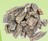
Dekoračný kameň Kamenná kôra Frakcia: 10 – 30 mm