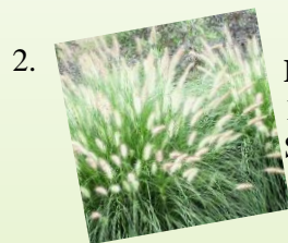
2. Perovec psiarkovitý 1 m 2 / 3 ks Slnčné stanovište