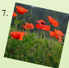
7. Vlčí mak 1 m 2 / 5 ks Slnčné stanovište