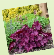
8. Heuchera hybrida 'Dew drops' 1 m 2 / 7 ks Slnčné, polotienisté až tienisté stanovište